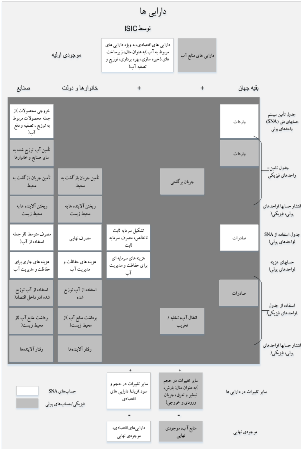
شکل ۲. سیستم حسابداری اقتصادی - محیطی برای چارچوب آب (برگرفته از سازمان ملل متحد، ۲۰۱۲)